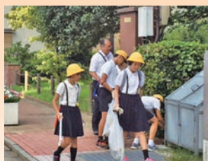
子ども達と共に 金沢駅周辺清掃活動