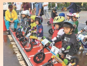
メルヘンおやべ ランバイクレース事業