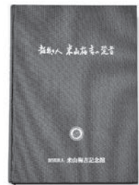
B5判 記念館35周年記念誌 本文268ページ/2,500円