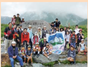
養護施設伊奈美園児童 招待立山登山