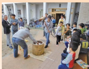
聖霊愛児園餅つき大会