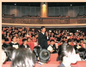
君の笑顔が未来を連れてくる 「子ども夢メッセージ」事業