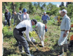
水源の森プロジェクト