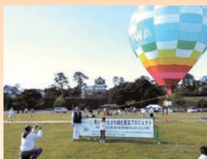
青少年緑化推進気球事業