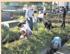
トミヨの保護と 河川の水質保全事業