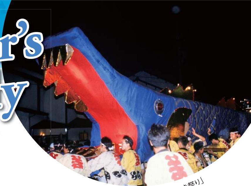
「加賀市動橋町ぐず焼き祭り」