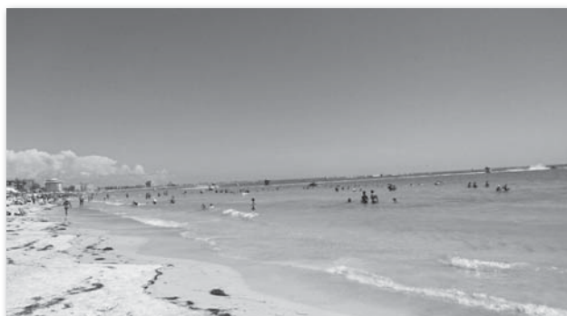
セント・ピート・ビーチ