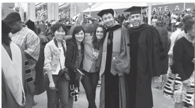
大学院生の卒業式にて

南フロリダ大学での研究を将来的に医療に活かすことができるように、日々精進していくとともに、ロータリーの会員の皆様に始めたくさんの方と交流したいと思います。今後ともよろしくお願いいたします。