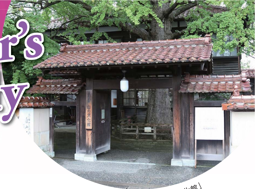
「深田久弥 山の文化館」