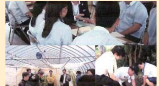
志賀高校存続プロジェクト