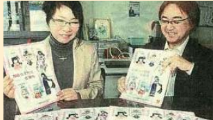
千代女をキーワードに新しい地域文化を創造するプロジェクト