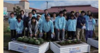
加賀温泉駅前花壇植替清掃作業