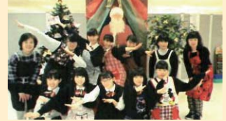
オヤヤこども食堂への支援