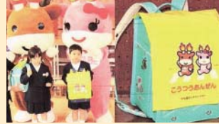
小矢部市内小学校新入学児童へ交通安全ラウンドセルカバー贈呈事業