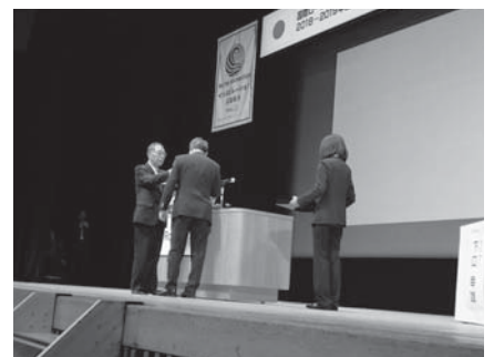
ガバナーラベルボタン伝達