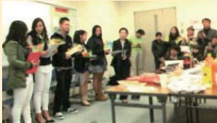
日本在住の外国人の子供への支援