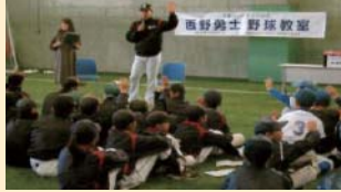
西野勇士野球教室