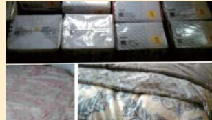
特定非営利活動法人シキせりり支援事業