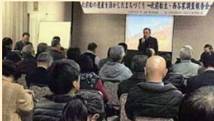
日本遺産北前集落加賀橋立西谷家調査支援