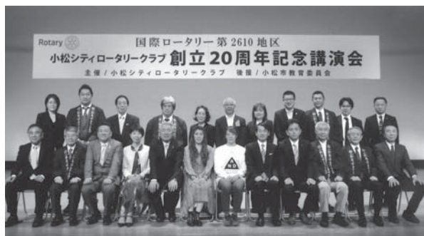
平成30年4月27日(金) 小松市公会堂