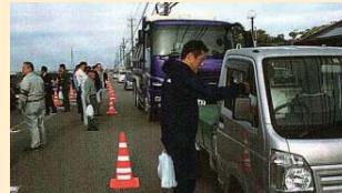
交通安全呼び掛け運動