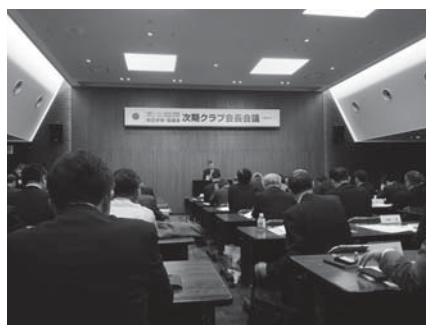
次期クラブ会長会議