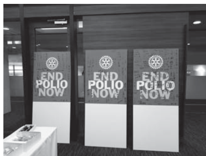
ポリオプラス寄付会員の寄書き