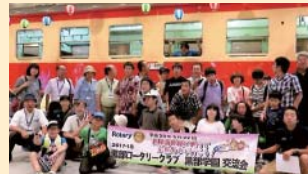
黒部学園交流事業