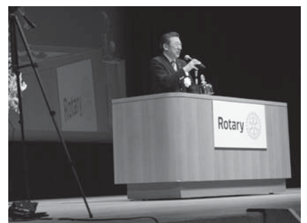
若林次期ガバナー地区目標説明