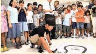
10年後の人材を育てようプロジェクト