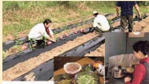
二トひきこもり支援事業