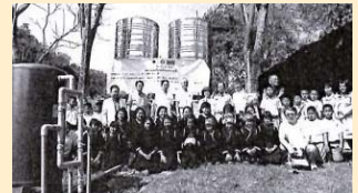
タイ国ホームエーチャン小学校浄水器設置事業