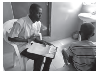
Basse病院における看護師による問診の様子