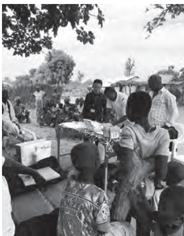
村での研究内容説明の様子。村長の声かけで多くの村民が集まり、皆が説明を注意深く聞いています。

なお、Basse地域にはロータリークラブがないため、現地ロータリアンとの交流ができず寂しい思いをしておりましたが、来年1月にFajaraに戻った後には、再度ミーティングに参加し、積極的にロータリアンとの交流を図りたいと思います。