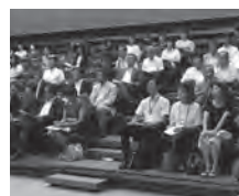
東となみRC(8RC).高岡市園児・児童むし歯予防保健教育