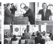
能美RC.地域発展事業「安全運転呼び掛け運動」