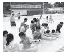
高岡万葉RC.愛育園支援事業