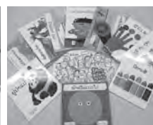
富山南RC.ラオスへ絵本を届ける運動