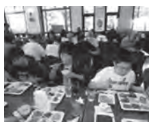
黒部RC.富山県立黒部学園生たちとの交流会