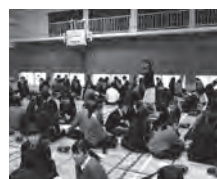
小松シティRC.石川県立小松明峰高校 アクティブラーニング教育