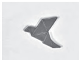
ロータリー平和センターのピン

*平和の推進(2月:平和と紛争予防／紛争解決)、疾病との闘い(12月:疾病予防と治療)、水と衛生(3月)、母子の健康(4月)、教育の支援(9月:基本的教育と識字率向上)、地域経済の発展(10月:経済と地域社会の発展)