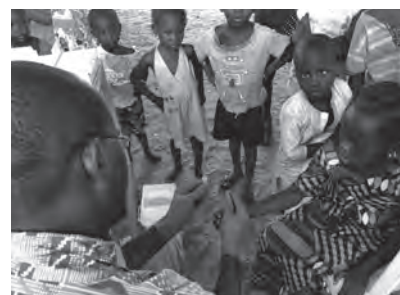
村における指からの血液検体採取の様子