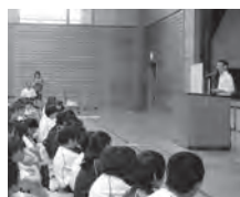
射水RC.心肺蘇生法実技講習会