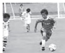
加賀ロータリークラブカップ U-10サッカー大会