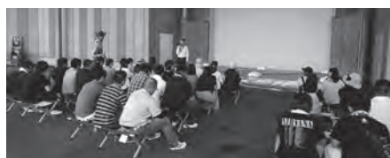
小松RCと輪島RC合同婚活