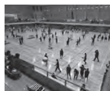
越中八尾RC.ジュニアビーチボールYATSUOカップ