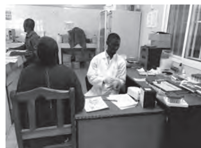
Basse病院における検査技師による検体採取の様子