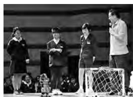
小矢部RC. 君の未来がもっと輝く「子ども夢ロボット&トーク」開催事業