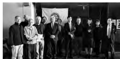
七尾RC. 新世代プログラム 高校生のための映画「オケ老人」鑑賞会