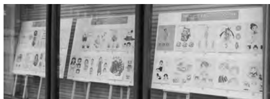
白山RC. 千代女をキーワードにして新しい地域文化を創造するプロジェクト