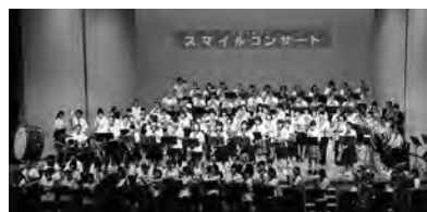
七尾RC. 第6回ロータリースマイルコンサート