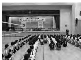
七尾RC. 第23回七尾ロータリー旗中学生女子バレーボール大会