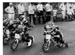
小矢部中RC. メルヘンおやべらんバイクレース