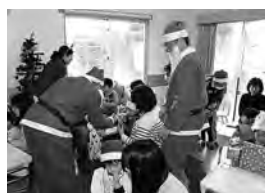
魚津RC. 知的障害児通園施設「つくし学園」支援事業