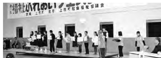
上市RC. 障がい者と小中高生とのふれあい活動支援事業