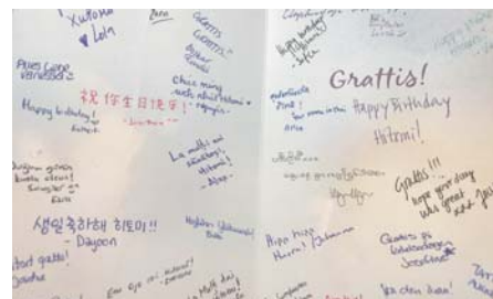
お誕生日にクラスメイトからもらった寄せ書きの誕生日カードの写真です。