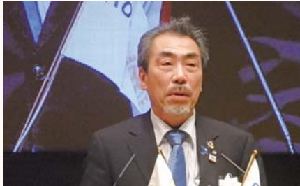
ガバナーエレクト 八塚 昌俊