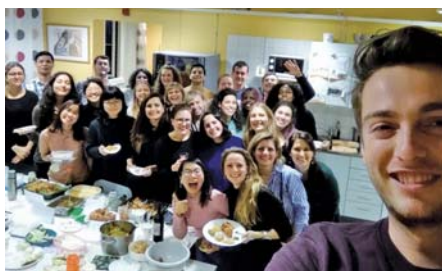
クラスメイト(同じプログラムの学生)と各国の料理を持ち寄ってパーティーをしました。

今年8月末からスウェーデンのルンド大学で国際開発・マネジメントを学ぶためロータリー財団地区奨学金奨学生として留学中。