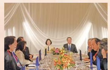
パーティテーブル