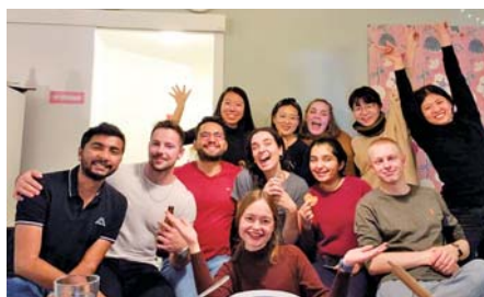
寮のコリドアメイトと一緒に夕食を作ってパーティーをしました。