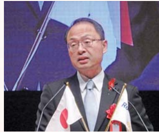
金沢市長 山野 之義 様