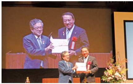
RI 会長代理とガバナー (記念品贈呈)