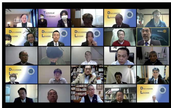
(11月15日32名の参加者、Zoomにてガバナーもご参加いただき開催)