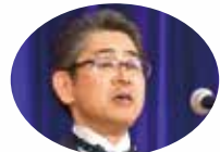
黒川ガバナー歓迎挨拶