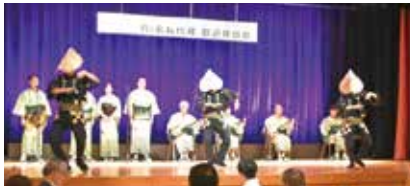
越中おわら節演舞