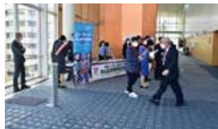
米山奨学会・校友会