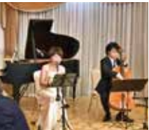
クラシック三重奏