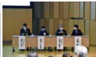
ガバナー・RI会長代理 ご夫妻