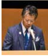
大会決議報告 藤谷地区幹事