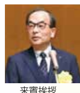
来賓挨拶 富山県知事代理 副知事 蔵堀祐一様