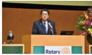
黒川伸一ガバナー挨拶