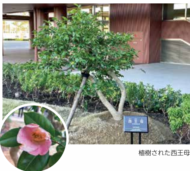
植樹された西王母