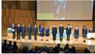
インターアクト紹介