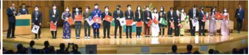
米山記念奨学生紹介・活動報告