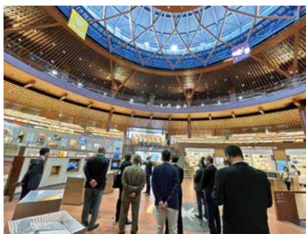
新しい県立図書館の内部の説明を聞く会員