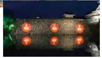
END POLIO NOW イルミネーション 富山城