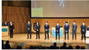
ローターアクト紹介