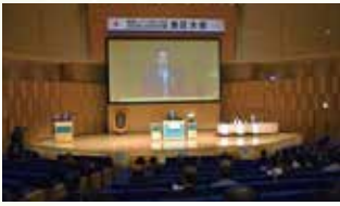
指導者育成セミナー開会