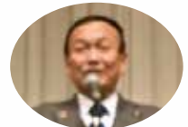
富山市長 藤井裕久様