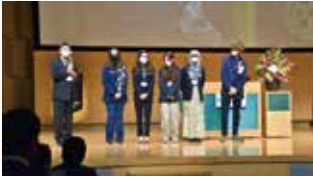
青少年交換学生紹介