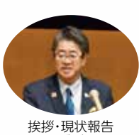
挨拶・現状報告 黒川ガバナー