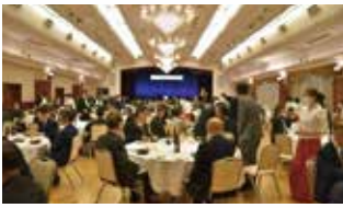
RI会長代理歓迎晩餐会