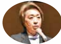
記念講演 参議院議員 橋本聖子氏