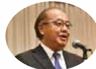
富山県知事 新田八朗様