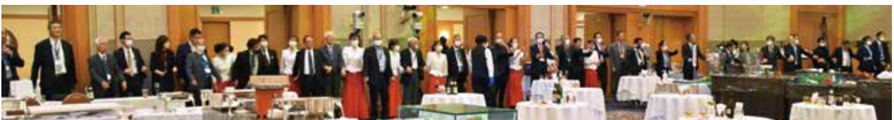
恒例の手に手つないで大懇親会が閉会

お詫び 去る10月に開催された地区大会での表彰に関して、ロータリー賞受賞の9クラブ(大会冊子56ページ)のうち、小矢部ロータリークラブと記載がありますが、正しくは 小矢部中ロータリークラブ と成ります。両クラブ様には大変ご迷惑をおかけいたしました。訂正させていただきますと、あらためてお詫びを申し上げます。