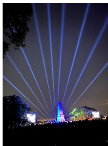
ANZAC DayのDawn service