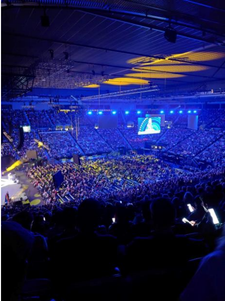
【メルボルン大会開会式】

言葉に自信がない私は翻訳アプリが大活躍、会議には通訳ガイドと会場には日本語スタッフもおりますが、楽しみたい気持ちが全てを埋めてくれるでしょう。