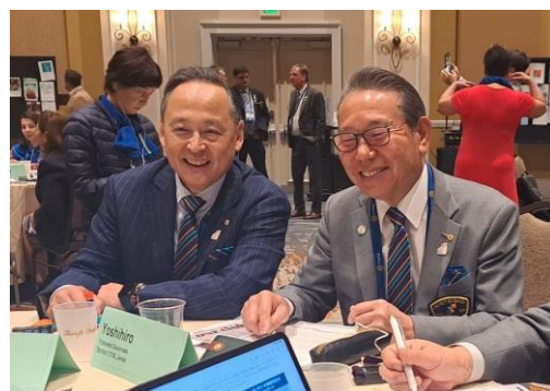
【ワークショップにて】