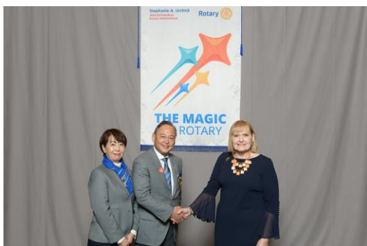
【次期RI会長と新しいテーマロゴの前で】

この6日間の貴重な経験を活かして、当地区のクラブを支援し強化する計画を立案し、ガバナー年度に臨みたいと思います。