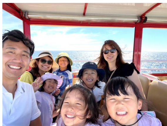
【友人家族とバスセルトン栈橋を走る電車の中】 (千と千尋の神隠しの海の上を走る列車のモデル) 左；筆者