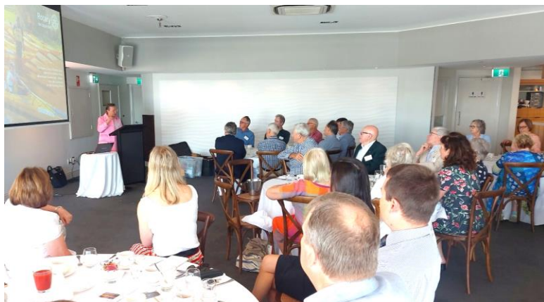
【12月の定例会にて。Professor Fiona Wood講演会の様子】