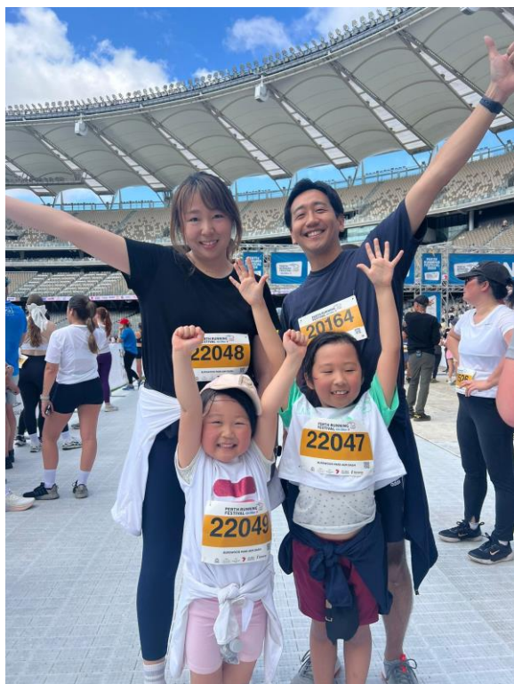
【Optus Stadiumでのマラソン大会】

私の研究についてですが、扱う細胞の種類が増えてきて細胞と向き合う日々が続いています。いつの間にか細胞培養室の主のようになっていきます(笑)。私の研究プロジェクトは大きく3つのステップがあり、現在2つ目のステップに取りかかっているところです。基礎研究は想像以上に多くの時間を要し、予定通りには進まないかと痛感している所であります。また、8月にはシドニーでPD Academyという腹膜透析の勉強会に参加しました。腹膜透析は私の研究テーマでもあり、オーストラリアの腹膜透析治療の第一線で活躍している医師たちと知り合うことが出来、大変有意義なものとなりました。