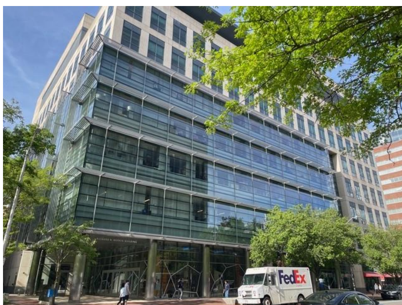
Broad Institute of MIT and Harvard