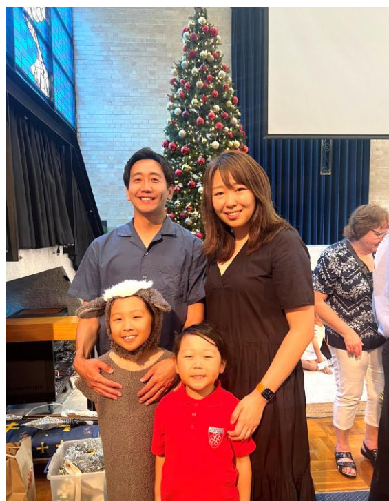
【 Nativity Playの発表会 】

日本でのNativity Playではマリアとヨゼフが主役ですが、オーストラリアではDonkeyがマリアとヨゼフに並ぶ大役のようで、娘がそれに抜擢され、自信を持って演じていた姿に大変感動しました。また親子で参加するダンスコンサートがあり、クラス全員の親子でダンスをしたのも思い出深いものになりました。パースに来て2年、優しい先生、友達に恵まれ、様々な体験を通して自信がつき、学校生活を楽しく過ごしている子供は本当に素晴らしいです。同時に日々、子供達を支え、現地校のお母さんやお父さん達との交流を積極的に深める努力をしている妻にも感謝しています。