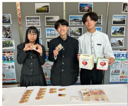
【能登応援ブースでの販売活動】