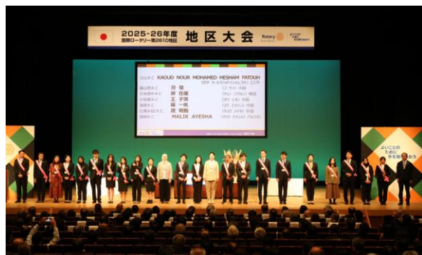
【米山奨学生の紹介】