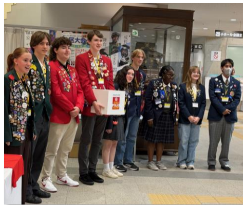
【交換留学生のポリオ募金活動】