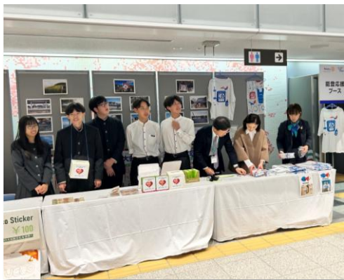
【能登応援ブースでの販売活動】