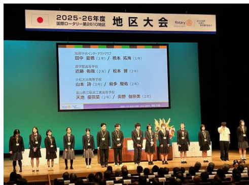
【インターアクトクラブの紹介】