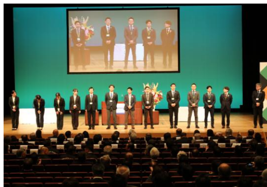
【ローターアクトクラブの紹介】