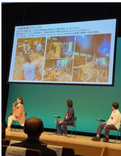
【クロストークで話される俳優の常盤貴子さん】